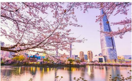
ชมซากุระทะเลสาบชอกซอน