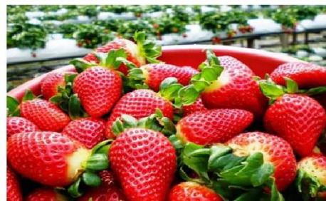
ฟาร์มสตอเบอร์รี่