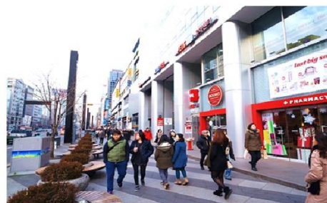
ช้อปปิ้งคังนัม