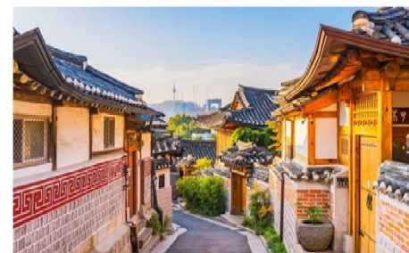
หมู่บ้านโบราณชุกซอน